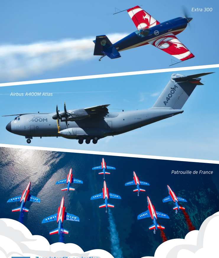
— Airbus A400M Atlas